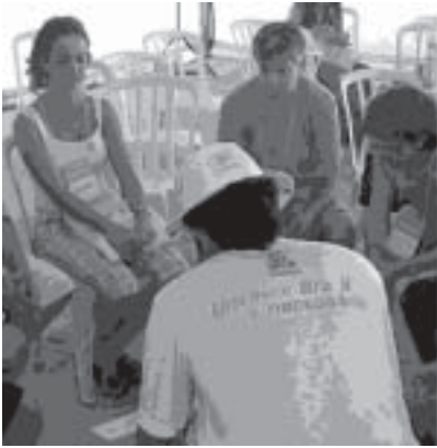
Plate-forme de l'Economie Solidaire

La construction de la Plate-forme de l'Economie solidaire a démarré à l'occasion du 1 er Plénier national (en décembre 2002, à São Paulo) jusqu'à arriver à la version que nous présentons ci-dessous, en 7 axes, qui est le résultat du III ème Plénier national d'Economie solidaire, le même qui a créé le Forum brésilien d'Economie solidaire. La Première rencontre nationale d'entrepreneurs solidaires, tenue en août 2004, a enrichi et a approfondi certains aspects de cette Plate-forme, qui est tenue à la disposition dans les Forums des Etats et au Secrétariat exécutif national.