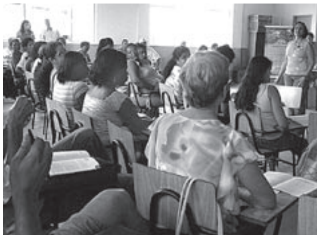
Encontro. A última plenária reuniu 64 pessoas

Na última plenária do Fórum de Economia Popular Solidária do Espírito Santo (Feps), realizada em 25 de março, foram referendados os nomes dos cinco coordenadores do Fórum que irão integrar o Conselho Estadual de Economia Solidária como membros efetivos e eleitos os seus respectivos suplentes.